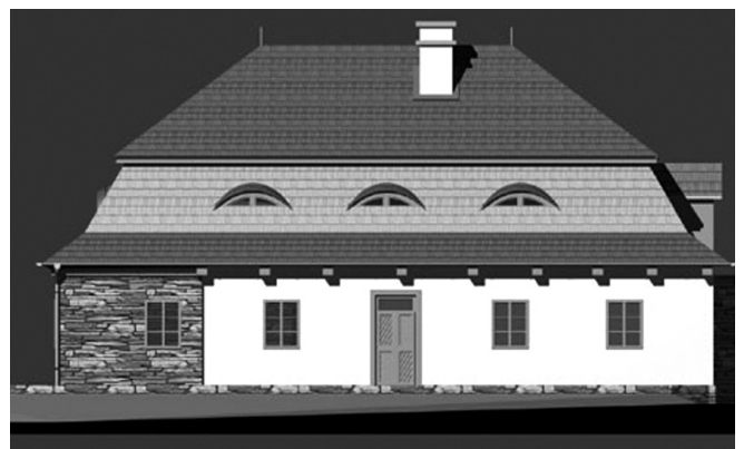
Projekt rekonstrukce dle schváleného projektu, přilepující masivní kamennou/betonovou část přímo k pravé straně objektu místo původní samostatné stodoly a přetvářející usedlost do stylu „podnikatelského baroka“; změna historického vstupu do objektu (skrz nejstarší část – kuchyň s valenou klenbou).