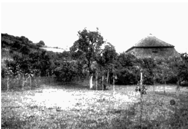
Historická situace – foto z r. 1928.