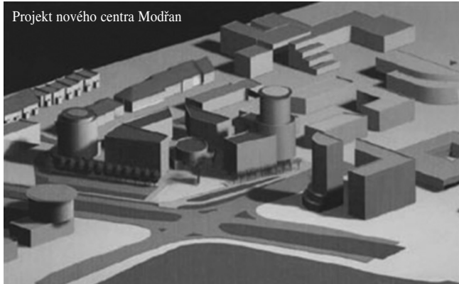
Projekt nového centra Modřan